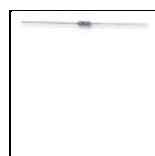
RESISTOR, 10K, 0.25W, 1% MULTICOMP MF25 10K