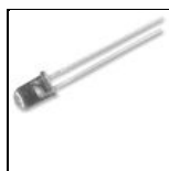
LED, ORANGE, 5MM, STANDARD MULTICOMP 703-0099